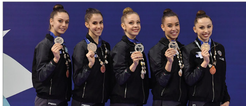
La Squadra nazionale di Ginnastica Ritmica stringe tra le mani la medaglia d'argento del concorso generale