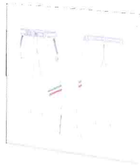
Singapor 17 Pantaloni Tuta