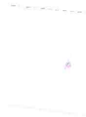
Singapor 09 Calze Sport