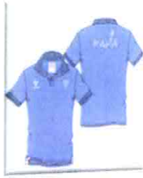
Singapor 02 Polo Maniche Corte