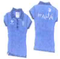
Singapor 12 Polo Maniche Corte