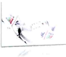
Singapor Scarpa Running 19