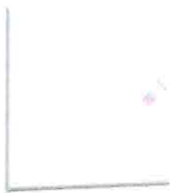
Singapor 09 Calze Sport