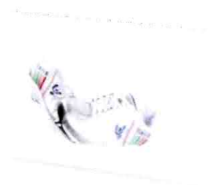
Singapor Scarpa Running 19